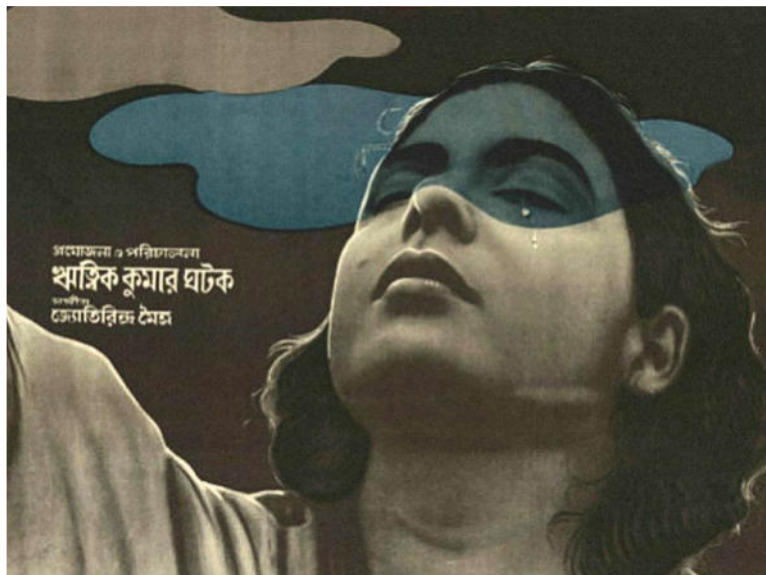
Meghe Dhaka Tara (1960)

Biblioteca Pública de Salamanca V 22 - 20:00 h