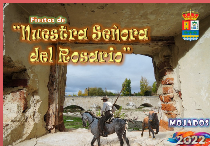
Alba Calonge Viana