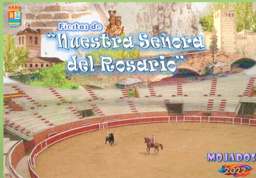
Alba Calonge Viana