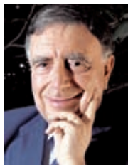
LUIS MARÍA ANSON de la Real Academia Española